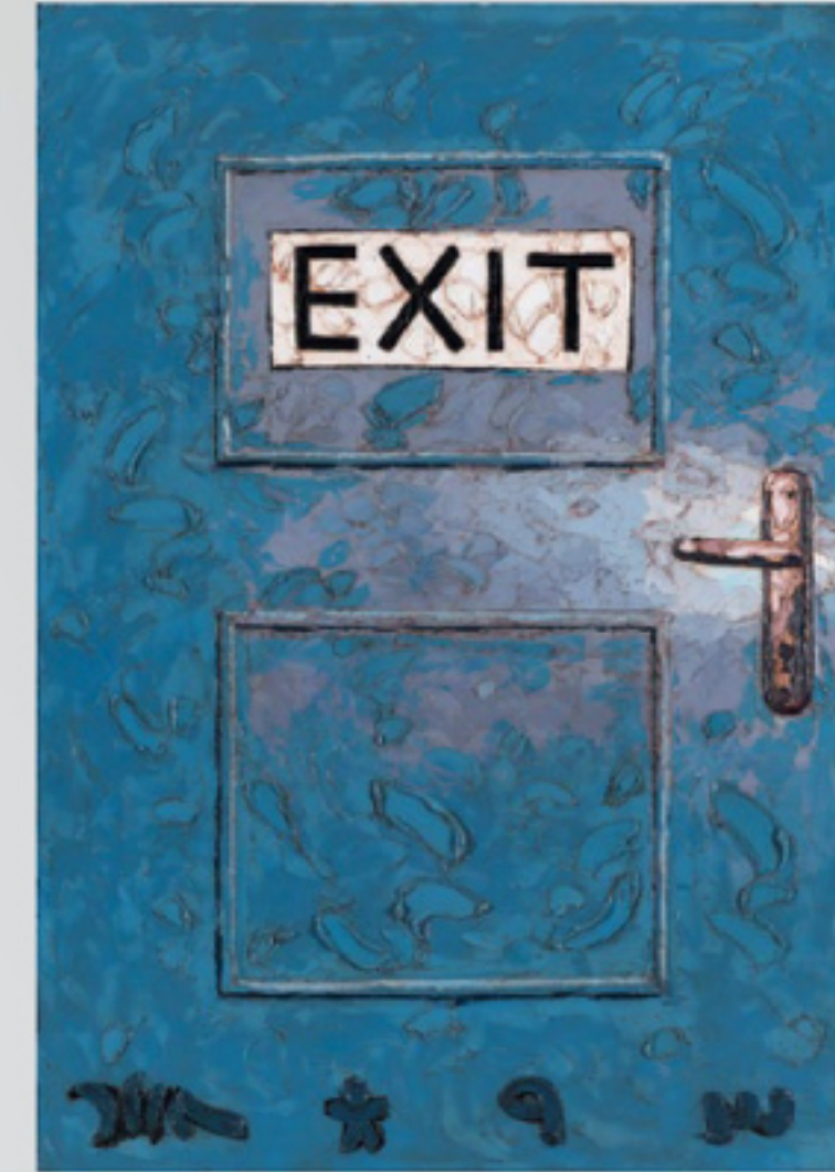
2014, Babak Roshaninejad, Interlude serisinden, taval üzerine yağlı boya /// No.9 from the Interlude series, oil on canvas

After the 1950s the art in Iran evolved rapidly and actively and by the 1970s the art in Iran was experiencing a boom.