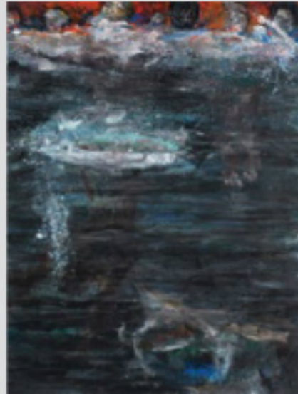
2008, Alireza Adambakan, Haftad-o-Du-Tan serisinden /// Camp on Fire, from the Haftad-o-Du-Tan series